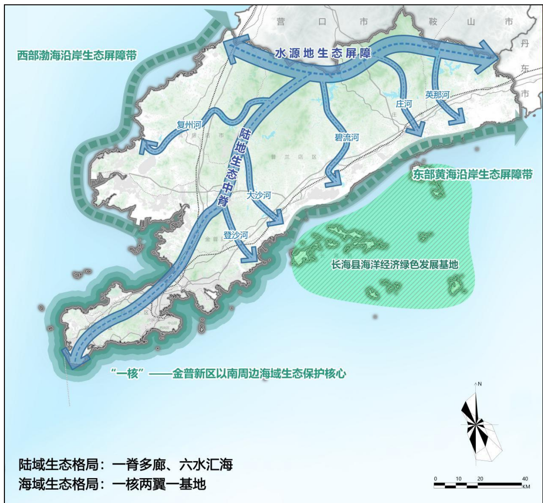
大连市生态空间格局图

开展全域生态保护与修复。严格自然保护区、森林公园、湿地公园、地质公园、文物保护区、永久基本农田等重点生态功能区保护，推动矿山综合整治和地质灾害防治。提升生物多样性保护水平，构建生物多样性监测体系。坚决打击非法捕捉、交易野生动植物，防范新的外来物种入侵。加强海洋生物、野生动植物资源及栖息地生态保护修复。以自然修复为主、人工修复为辅，开展受损生态系统修复。加快蓝色海岸带修复，推进沿海防护林