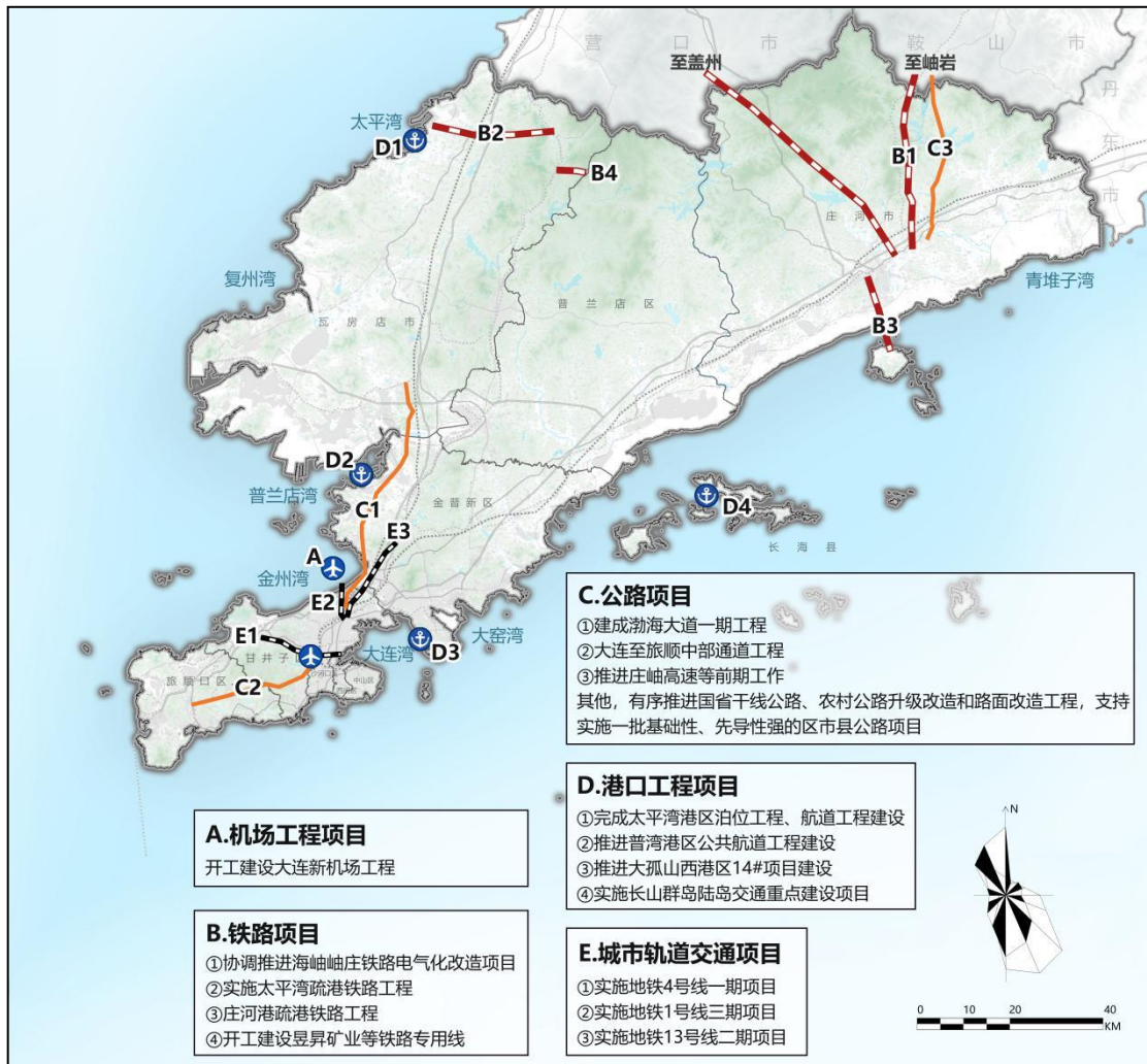
大连综合交通规划示意图