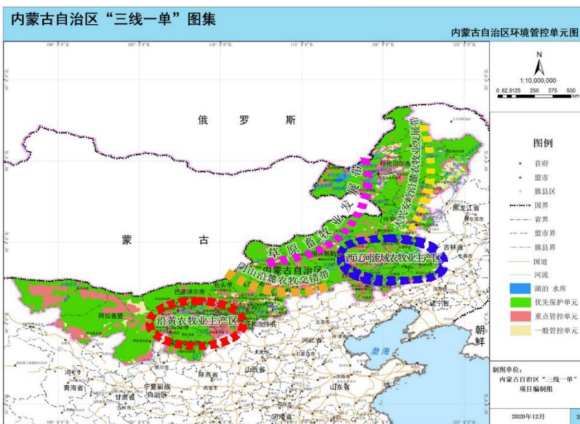
图3 “两区三带”和“三线一单”的符合性